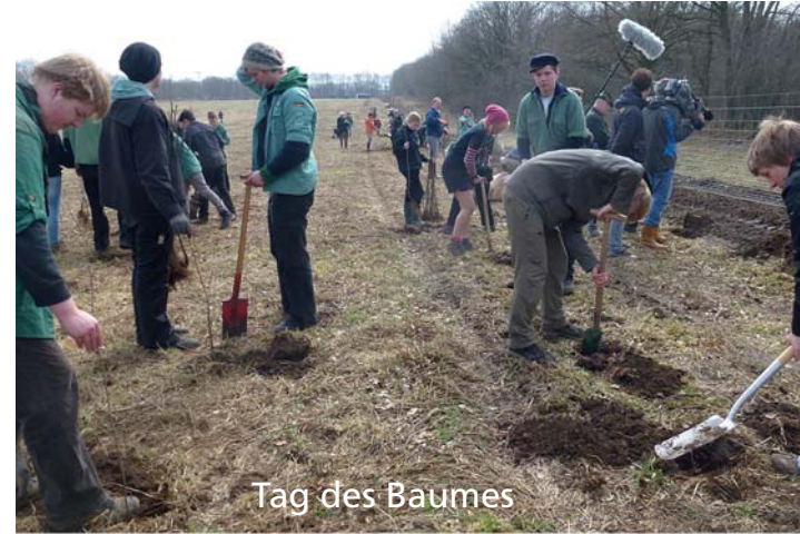
Tag des Baumes