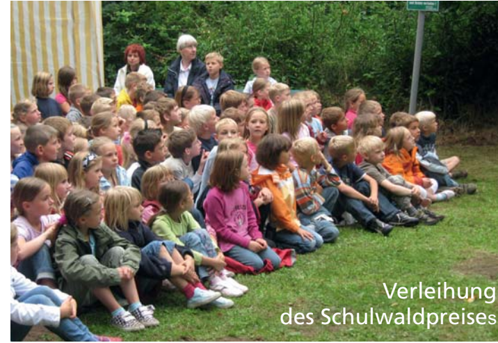
Verleihung des Schulwaldpreises

Unsere 12 SDW-Kreisverbände sind ehrenamtlich vor Ort aktiv. Das Angebot reicht von interessanten Exkursionen, Tagungen oder Fortbildungen bis zu Baumpflanzungen und Landschaftspflege. Besonders wichtig ist uns die Unterstützung waldpädagogischer Aktivitäten, wie die Waldjugendspiele, unsere Schulwaldarbeit oder die Arbeit mit den Wald- und Naturkindergärten in enger Kooperation mit den Landesforsten Schleswig-Holstein, den Kommunalen Forsten und dem Privatwald.