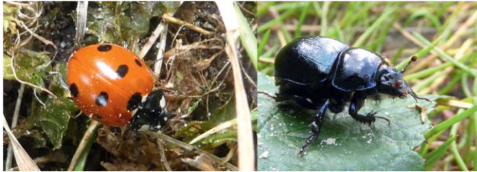
Siebenpunkt Marienkäfer und Waldmistkäfer

Käfer sind die größte Gruppe unter den Insekten. Wenn wir Insekten schützen wollen, müssen wir uns um Käfer kümmern. Sie sind faszinierende Tiere, bunt und spannend zu beobachten.