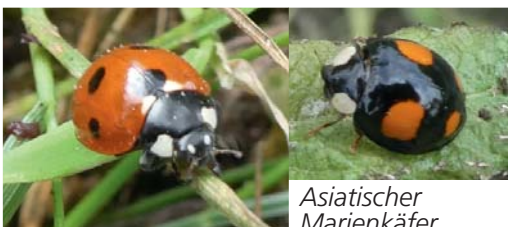
Asiatischer Marienkäfer Siebenpunkt Marienkäfer

Käfer sind Nahrungsspezialisten. Jede Art hat ihr ganz spezifisches Nahrungsspektrum. Viele Käfer ernähren sich von Aas, andere wie die Marienkäfer leben räuberisch. Marienkäfer und ihre Larven ernähren sich von Blattläusen. Deshalb wurde der Asiatische Marienkäfer eingeführt, der im Gartenbau als Nützling eingesetzt wird. Ein Marienkäfer frisst in seinem Leben etwa 5000 Blattläuse .