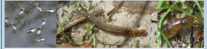
Taumelkäfer Larve des Gauklers Kopf der Larve

Käfer leben auch direkt auf der Wasseroberfläche und im Wasser, so wie die Gaukler und Gelbrandkäfer.