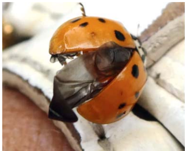
Marienkäfer beim Entfalten seiner Hautflügel

Käfer haben einen komplexen Lebenszyklus, der vom Ei bis zum ausgewachsenen Käfer 5 Jahre dauern kann. Nicht nur sie selbst sondern auch ihre Entwicklungsstadien brauchen unseren Schutz.